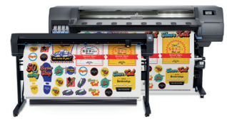
HP Latex 335 Print and Cut Plus-oplossing