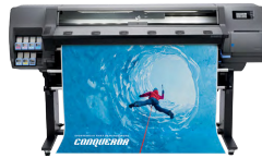
HP Latex 315-printer