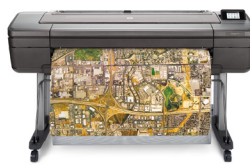
HP DesignJet Z6 PostScript® printerserie