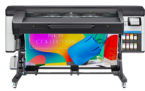
HP Latex 700-printer