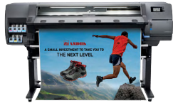
HP Latex 115-printer