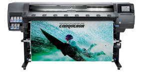
HP Latex 365-printer