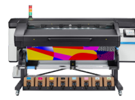
HP Latex 800-printer