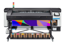
HP Latex 800W-printer