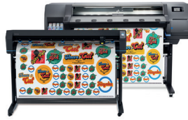
HP Latex 315 Print and Cut Plus-oplossing