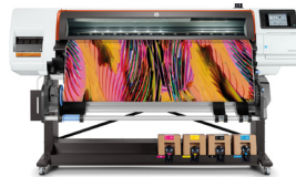
HP Stitch S500 64 inch printer