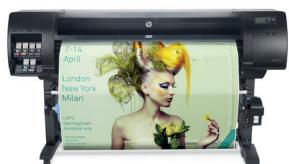
HP DesignJet Z6610 productieprinter

Hoogwaardige afdrucken, gedetailleerde ontwerpen en geweldige uitvoer. Doeken, kunst enz. krijgen een voorsprong met de grote verscheidenheid aan kleuren die beschikbaar zijn met deze technologie.