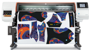
HP Stitch S300 64 inch printer

HP Stitch dye-sub printers bieden lang levendige en nauwkeurige kleuren voor alle apparaten. Ze zijn ideaal voor het printen van grote textielsoorten en maken toepassingen zoals gordijnen, kussens, bekleding, enz. mogelijk.