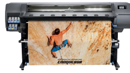
HP Latex 335-printer