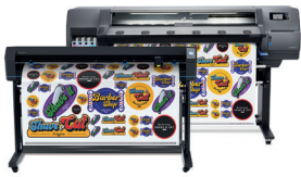
HP Latex 115 Print and Cut Plus-oplossing

Toegang tot een breed scala aan interieurdecoraties, waaronder rolgordijnen, synthetisch leer en wandbekleding. Met HP Latex-prints krijgt u geurloze afdrucken 1 die er droog uit komen, met een technologie die de certificeringen levert die belangrijk zijn voor uw operators, uw bedrijf en het milieu.