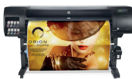
HP DesignJet Z6810 productieprinterserie