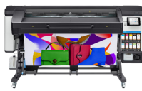
HP Latex 700W-printer