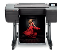
HP DesignJet Z9+ PostScript® printerserie