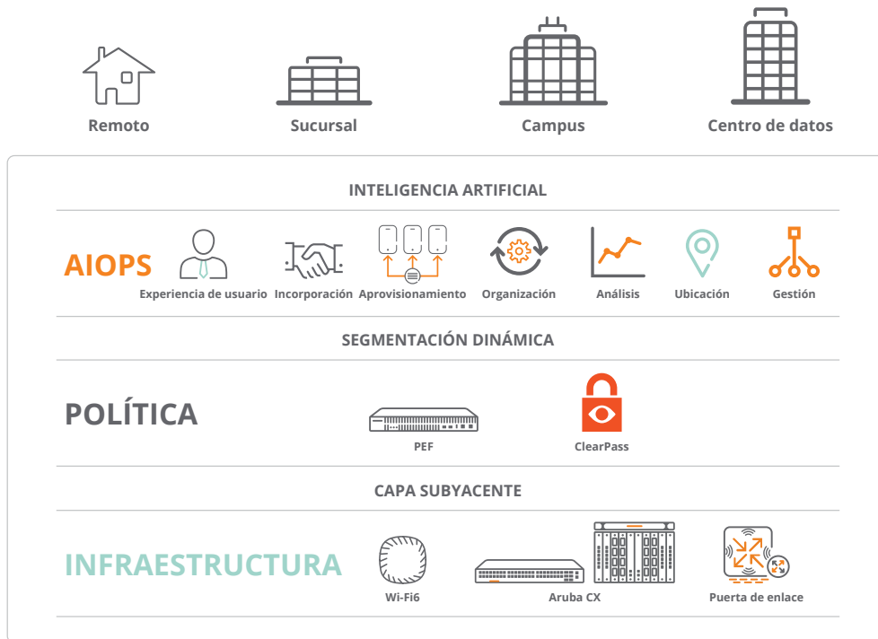
Figura 1: Infraestructura unificada de Aruba