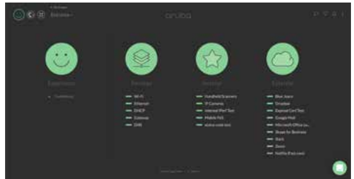
Figura 3: El panel principal Aruba UXI

Debido a las iniciativas de movilidad de la plantilla, la capacidad para ver y medir de forma remota la experiencia del usuario resulta esencial para la TI. La plataforma User Experience Insight (UXI) de Aruba permite ver el rendimiento