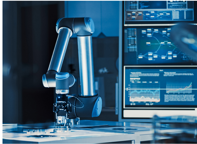
Abbildung 1 | Prowess Consulting hat evaluiert, wie sich der IT-Betrieb für ein KI-gesteuertes Inspektionssystem rationalisieren lässt.

Wir haben uns bei unserer Analyse auf Dell™ PowerEdge™-Server konzentriert, da diese Server speziell für Edge- und KI-Anwendungsfälle entwickelt wurden, eine intelligente Automatisierung für das Management bieten und dank Zero-Trust-Funktionen cybersicher sind. Diese PowerEdge-Server unterstützen außerdem nachhaltige Rechenlösungen durch eine energieeffiziente Performance.